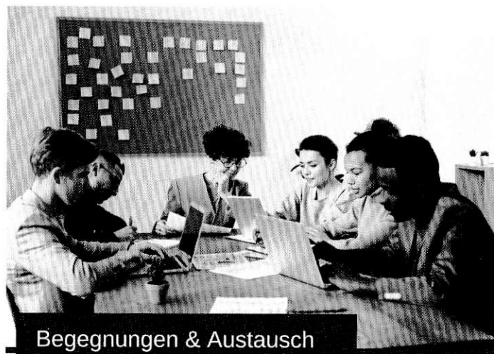
Begegnungen & Austausch

Wir bieten unseren Kunden offene Räume für Begegnungen, Austausch und gemeinsame Aktionen an.